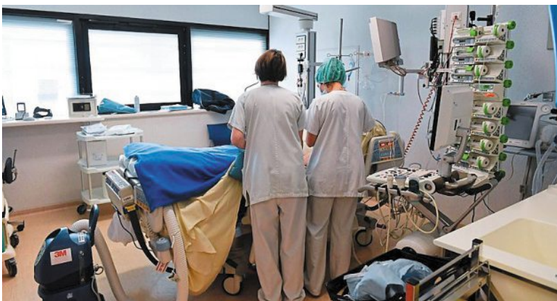
En Loire-Atlantique, l'agence d'intérim spécialisée dans la santé a plus de 30 postes non pourvus.