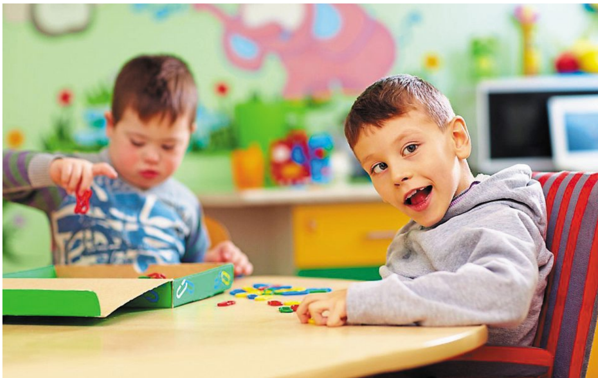
Trop d'enfants en situation de handicap sont sans solution adaptée à leur situation (photo d'illustration).

Quand une solution de soutien est finalement trouvée, ce n'est souvent qu'au bout d'une très longue année. Et les familles sont épuisées.