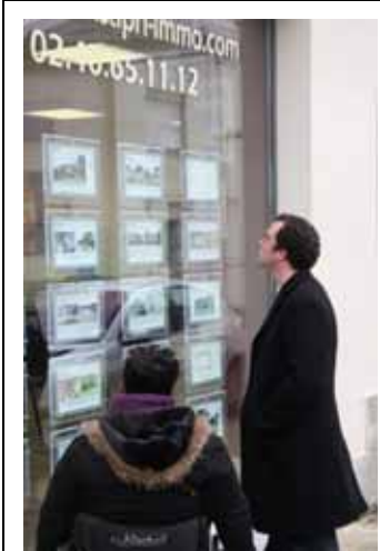
Le parcours du combattant commence