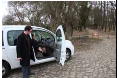
Bien sûr, ils rencontrent encore des obstacles...

Grrrr ! On peut même pas se promener avec ces pavés !