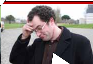
C'est vrai, c'est agaçant !