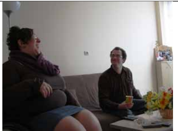
Déjà plusieurs mois qu'ils vivent ensemble, heureux...